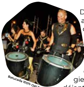
Batucada 100% OAI Spirit

Batucada, créatures, cirque et feu d'artifice