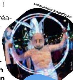
Les animaux fantastiques

Place ensuite à des créatures mythiques évoluant dans une fête foiraine, avec la Cie Elixir... Accompagnées d'un duo d'artistes circasiens qui proposeront un spectacle main à main et aérien.